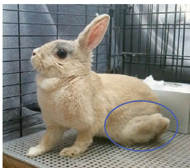
2010年12月10日 三鷹で保護された薄茶うさぎ♀

うさぎの骨は脆くて治りにくい含気骨です。そして うさぎは被捕食側なので驚きやすいのです。うさんぽ中にカラスや猫の気配に驚いた拍子に骨折したという話もききます。迷子や遺棄で外にだされたうさぎには天敵が多く 交通事故の危険もあり 本当に骨折しやすい動物なのです。仮に骨折のあとで自然治癒できたとしても下画像のようになります。この子の左後肢はもう動くことはありません。